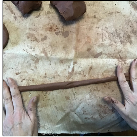
5. Make a series of coils that are about 1-1.5cm thick. ทำขดเป็นชุดหนาประมาณ 1-1.5 ซม.