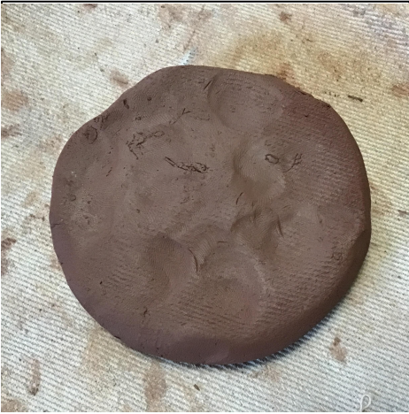
4. Keep it fairly rough because smoothing it will dry it out. ให้มันค่อนข้างหยาบเพราะการทำให้เรียบจะทำให้มันแห้ง