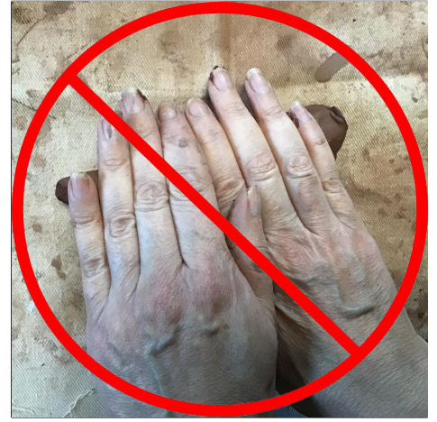
6. Remember that you are not squeezing the coils. Work quickly! จำไว้ว่าคุณไม่ได้บีบขดลวด ทำงานไว!