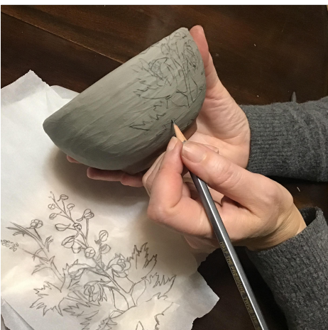
16. Do a very light rough sketch of your drawing on your pot. วาดภาพร่างคร่าวๆ ลงบนหม้อ