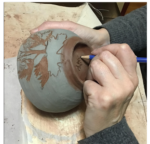
18. Finally, carve your name on the bottom. สุดท้าย สลักชื่อของคุณที่ด้านล่าง