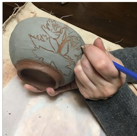
17. Take a sharpened pencil and carve through the slip into the brown clay. ใช้ดินสอด่ที่แหลมแล้วแกะสลักสลีปลงในดินเหนียวสีน้ำตาล