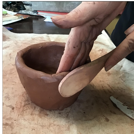
11. Shape your vessel by padding it with a wooden spoon or stick. ปั้นเรือของคุณด้วยการพายด้วยช้อนไม้หรือไม้