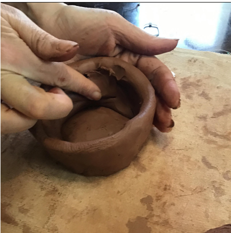
10. Smooth the inside with your fingers . If you can't reach, it is OK. ใช้นิ้วเกลี่ยด้านในให้เรียบ หากคุณไม่สามารถเข้าถึงได้ก็ไม่เป็นไร