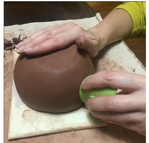
12. Shave it with a knife . Then smooth it with a metal/plastic/silicone rib . โกนด้วยมีด จากนั้นเกลี่ยให้เรียบด้วยซี่โลหะ/พลาสติก/ซิลิโคน